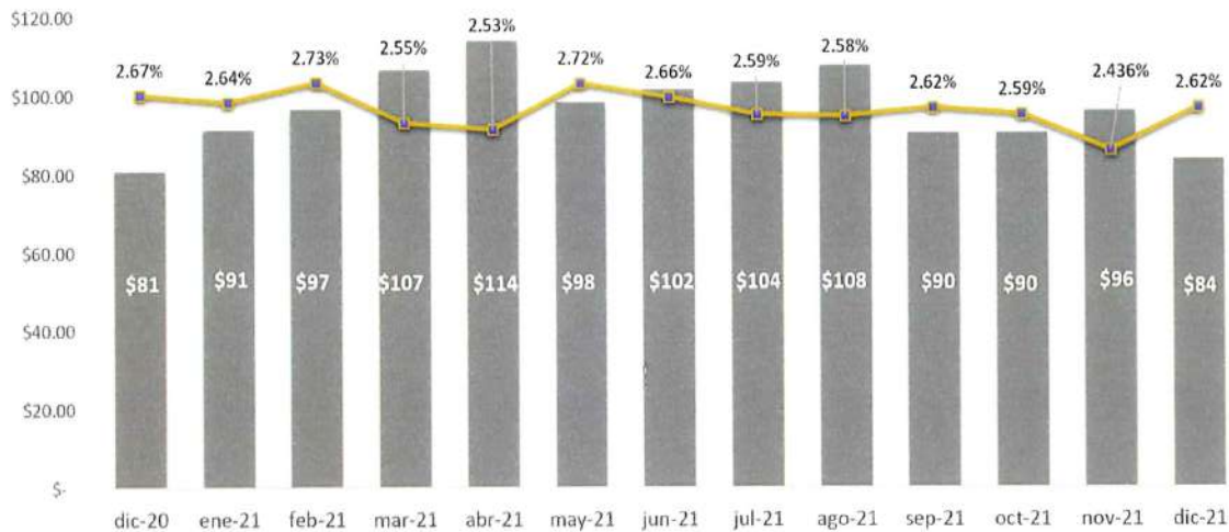
Saldos Promedio y Rentabilidad Mensual (US$ Millones)

De forma paralela a las medidas de liquidez, se mantuvo un permanente enfoque hacia la concentración de una mayor proporción del patrimonio en emisores de la más alta calidad crediticia, profundizando el análisis financiero de las contrapartes ante posibles deterioros que pudieran originarse en sus carteras dada la situación generada por la pandemia. Estas acciones permitieron mantener las mejores calificaciones dentro del mercado salvadoreño, mismas que fueron ratificadas en el mes de octubre en AA+fi por Zumma Ratings, S.A. de C.V. (en adelante "Zumma") y AAf por Fitch Centroamérica, S.A. (en adelante "Fitch").